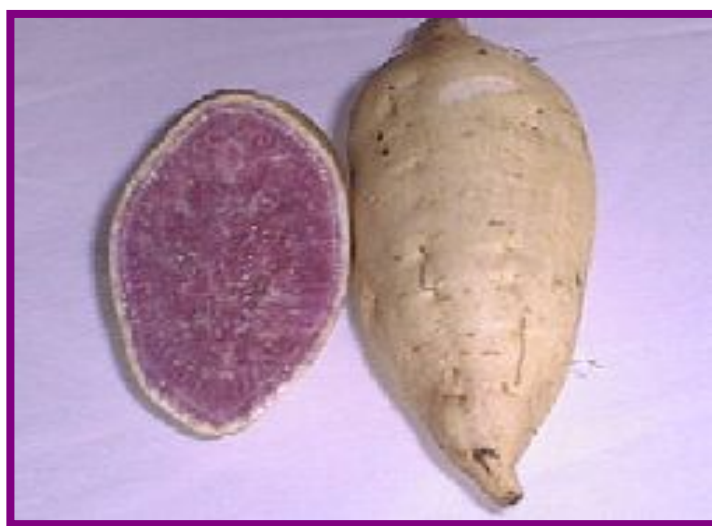
しろむらさき （種子島紫7号）非常に甘い「むらさき芋」です。在来種、変り種ですが、食味も良いのが特徴。抗酸化ポリフェノール的一种アントシアニンによる発色。ビタミンC、E、食物繊維、ヤラピン…と有用成分の塊。