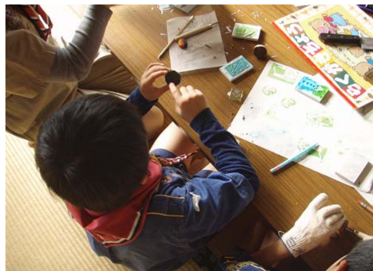
各自、苗字や名前の一文字を彫っています。