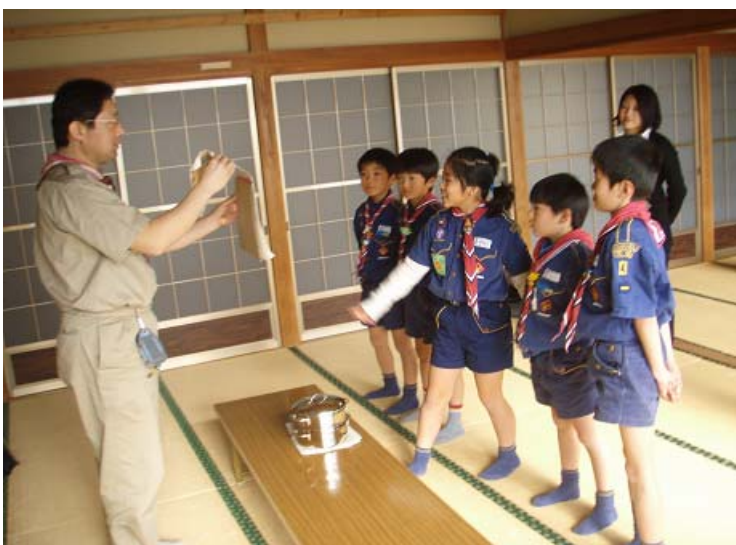
みんなで、完成作品の発表です。*詳細は下をご覧ください。テーブルの上の鍋が気になるようです