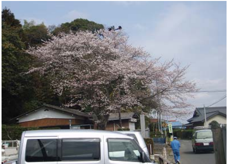
お寺のサクラもきれいに咲いています。