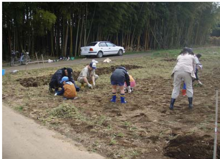
連作を避けるために、毎年作付け箇所を移動します。まずは草取り、