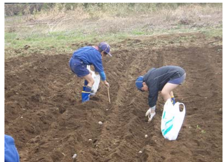
周辺の藪からは、「ホーホケキョ・ケキョ・ケキョ」とウグイスが鳴いています。