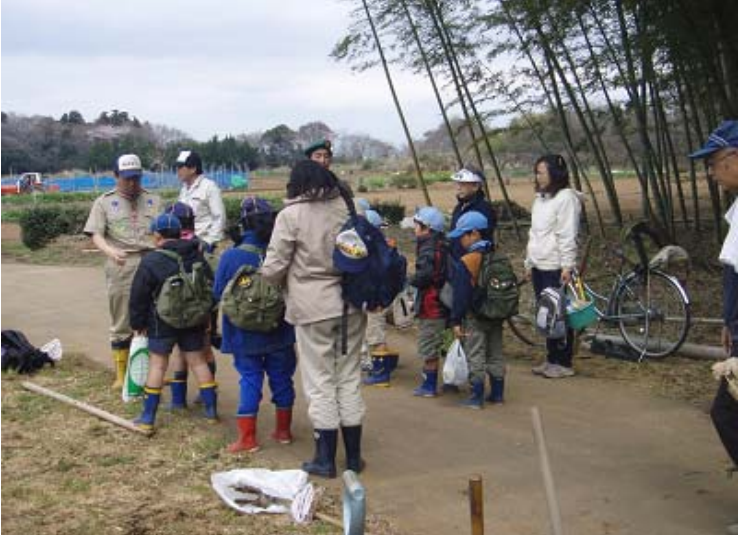
これより、アヤマメ園に戻ります。