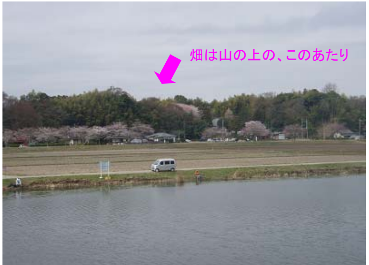
稲荷川添いのサクラも7分咲きです。