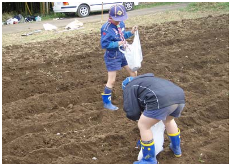
リーダー達が、掘った溝に種イモを置いていきます。