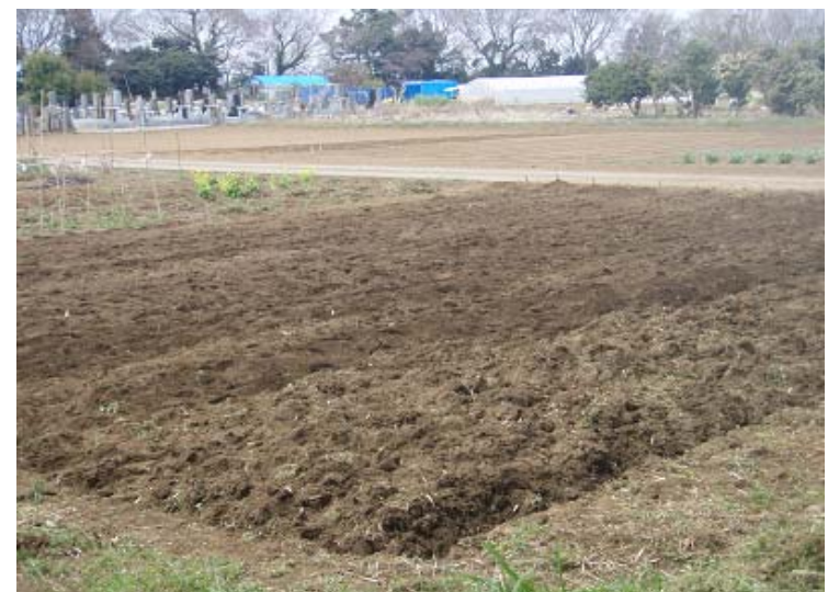
メークインとキタアカリ(たぶん)を植え付け完了！