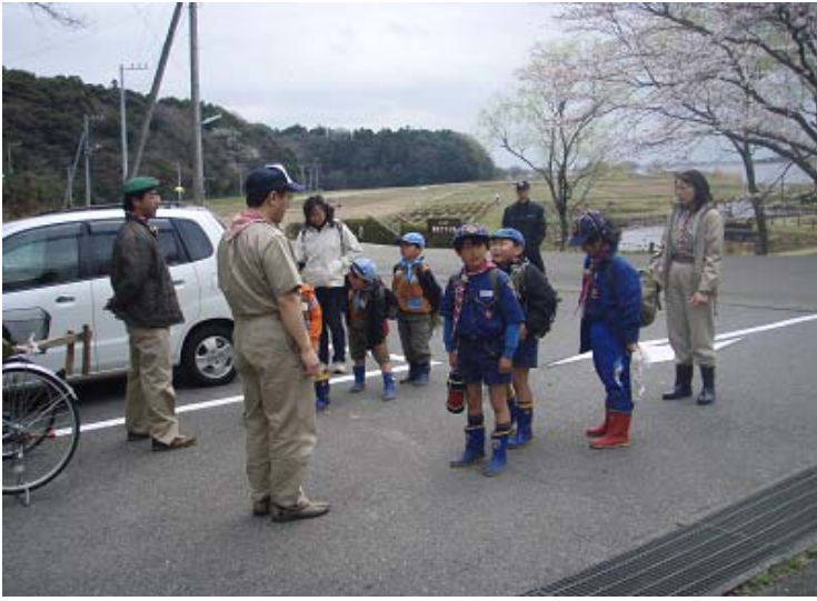
隊長より、ジャガイモの種類・料理法について研究して報告すること。チャレンジ章の「園芸家」に挑戦だ！

来週、ボーイ隊のご招待でビーバー隊は、サクラの下で野点(お茶会)の予定でしたが、予定より1週間も早く開花したので、「お花見」ではなく「お葉見」になりそうだ。これも自称晴れ男の某一隊長のせいかな？