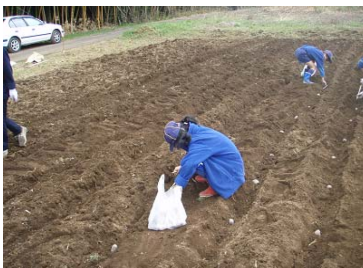
棒で間隔を測り、きちんと種イモを置きます。大人が少ないのでリーダー達は、もうへろへろです。