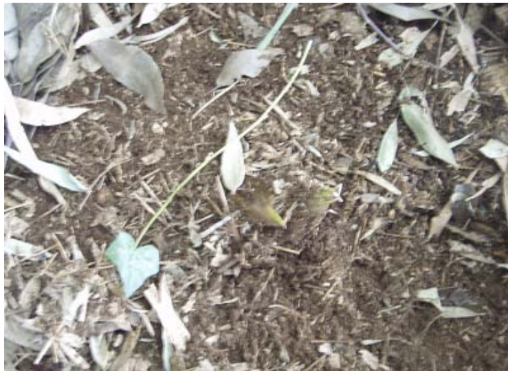
まさかこんな早く出る訳はないなと思いつつ、付近の竹山を散策していると、竹の子を発見！うまそー！