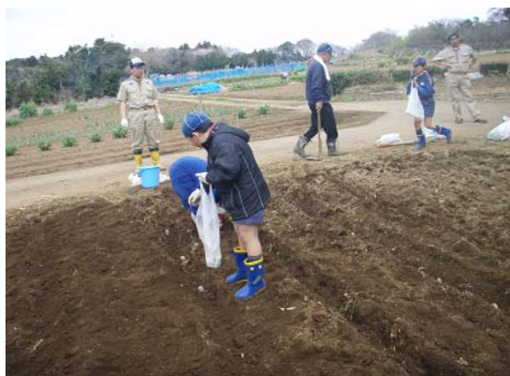
肥料を撒いて、土を被せます。