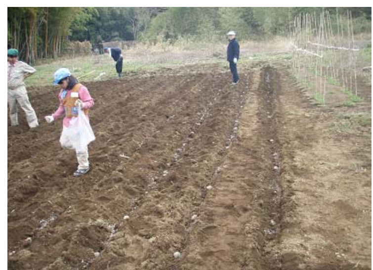
リーダー達が、掘った溝に種イモを置いていきます。左は耕作で腰の痛くなったビーバー副長。