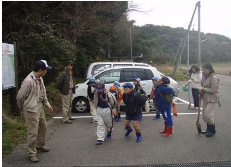
あやめ園の集合です。今回はカブスカウトとリーダーの欠席が多く苦戦が予想されます。