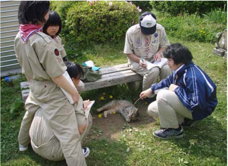
「なんだ、この猫めは」「クマ猫か？」 班長は、猫めをじゃらしている。