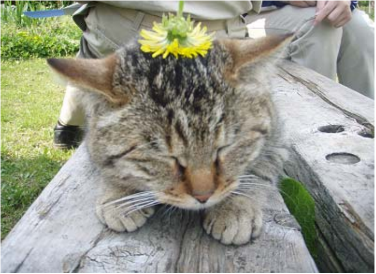
オス猫(未去勢)のわりには、おとなしい猫めだ。やられ放題である。

トラネコとは、日本猫でトラの模様のネコである。体毛の色により、次の様に呼び分けられる。 茶トラ(黄&茶)(レッドマッカレルタビー。赤猫ともいわれる) キジトラ(茶&黒)(ブラウンマッカレルタビー。毛色は緑がかった色合いのものもある。キジネコともいわれる) サバトラ(灰&黒)(シルバーマッカレルタビー) これは、スカウト技能・追跡の観察の「野外活動において出会う動物・昆虫について、生態、習性などをしり、そのこん跡等を探す。」に該当すんのかな？ スカウト環境行動スローガンの「3. すべての動物・植物の命を大切にします。」に該当すんのかな？