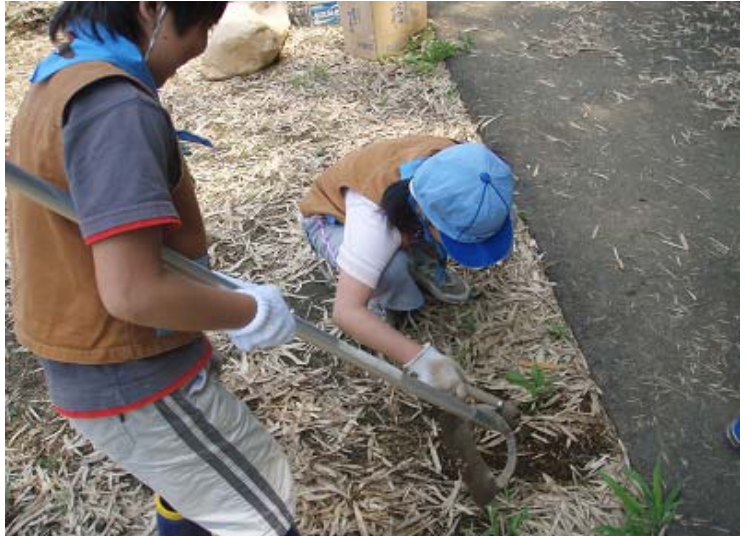
ミミズを発見して大騒ぎの写真。