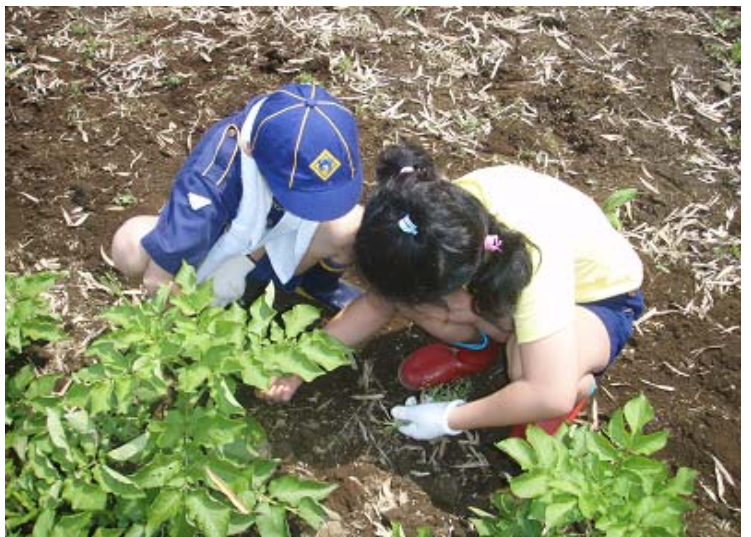
カブスカウトが、なにか観察中の写真。