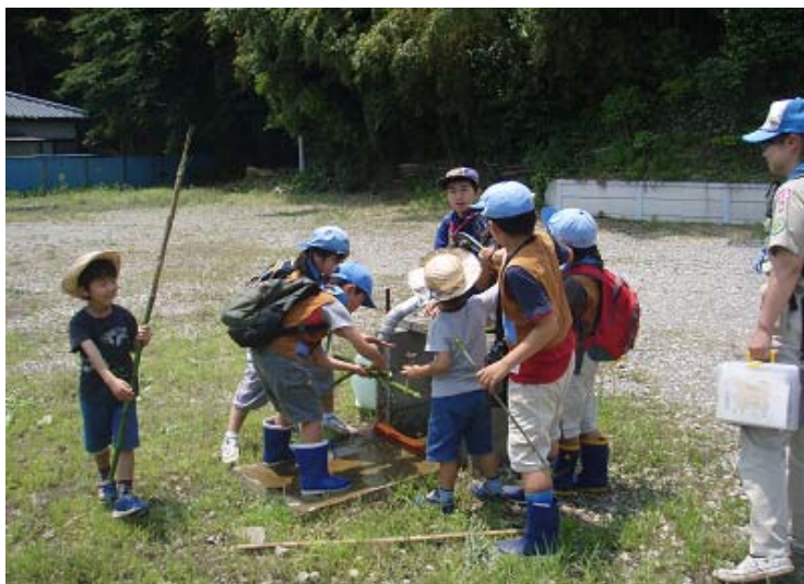
恒例の井戸ポンプ。ほっといたらいつまでもやっています。ビーパーの中に、一人カブが混ざっていますが。