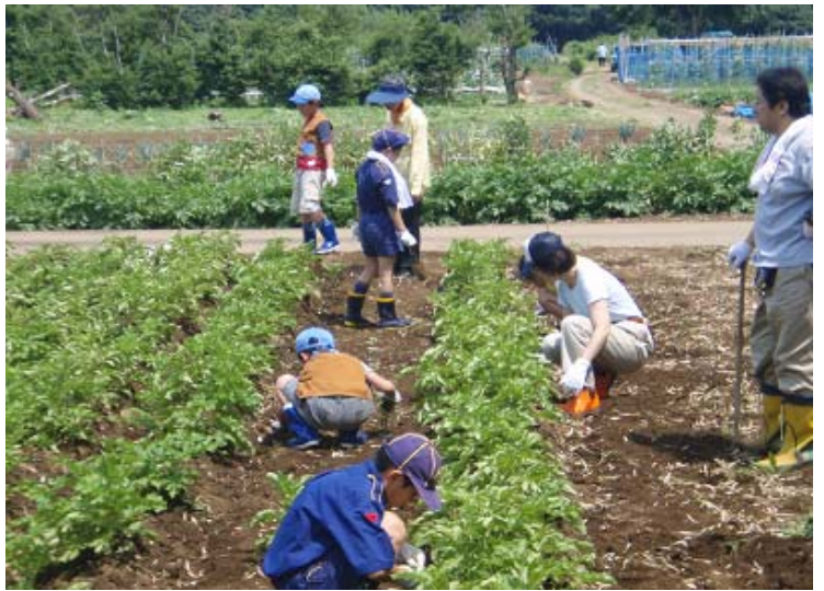
もくもくと雑草を抜いている写真。