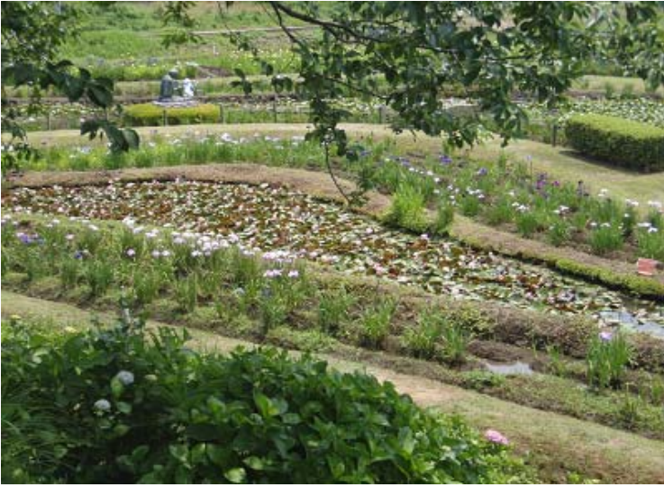
牛久市観光アヤメ園(アヤメ・ハナショウブ・スイレン)の写真。

本日は天候(25.3℃)に恵まれました、アヤメ園はアジサイと、アヤメ・ショウブ・スイレンが咲き誇り、大勢の見物客がいました。また、「うしく里山の会」の方々が、アヤメ園の再生事業を平成17年4月から行っているのので、年々、美しさが増して来ています。