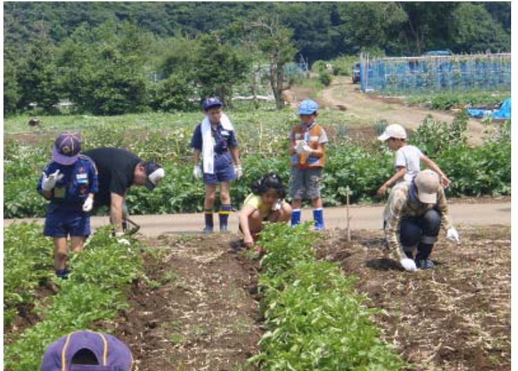
スカウト・父兄の草取りの写真。