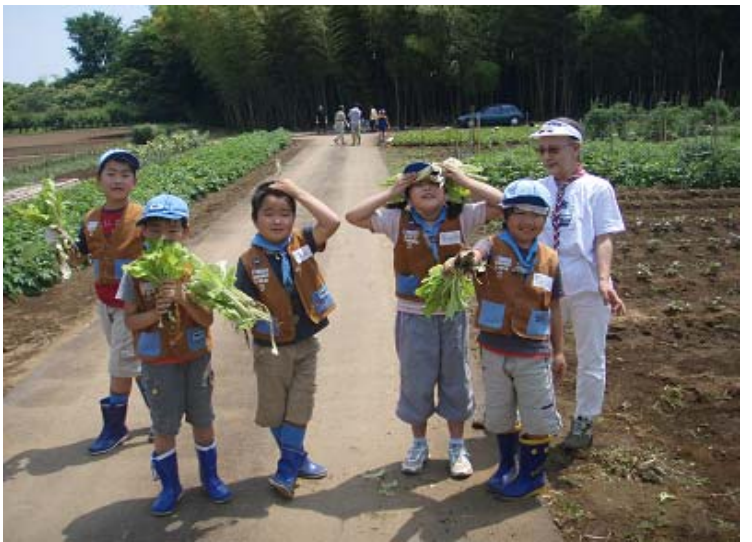
副団委員長の育てた中華菜を持って記念写真。