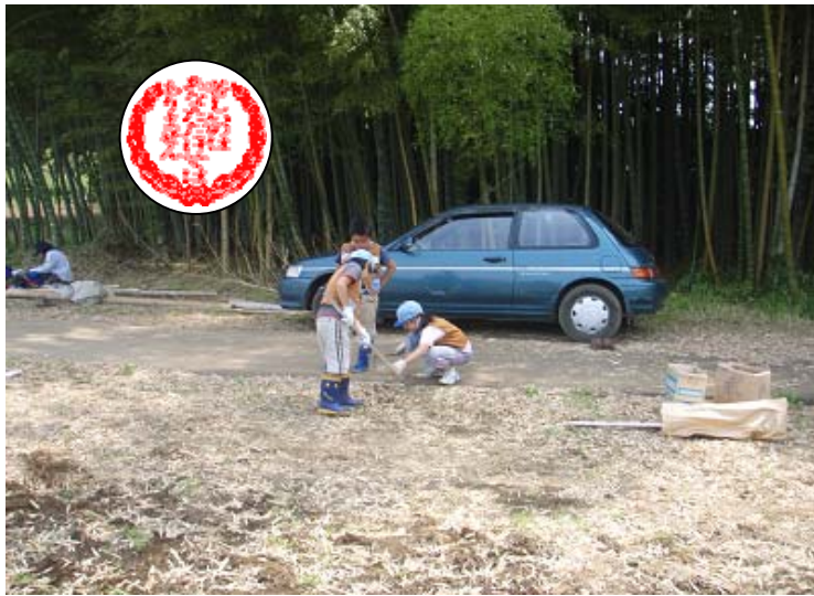
さぼりの常習犯の3人組の写真。