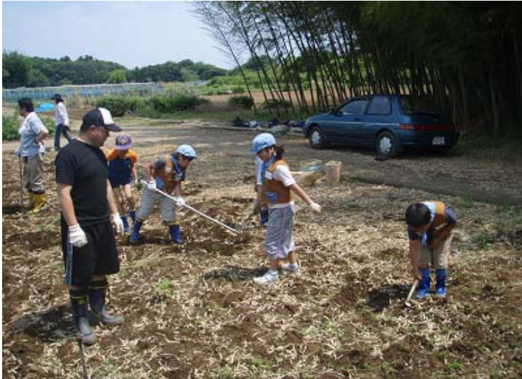
ついに関係ないところを掘り出し始めた写真。