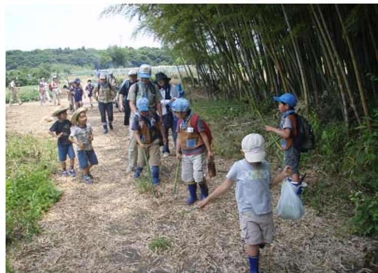
これより帰路に着く！