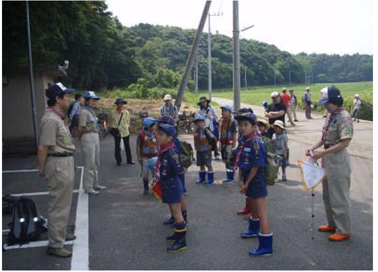
ビーバー・カブ隊集合の写真。