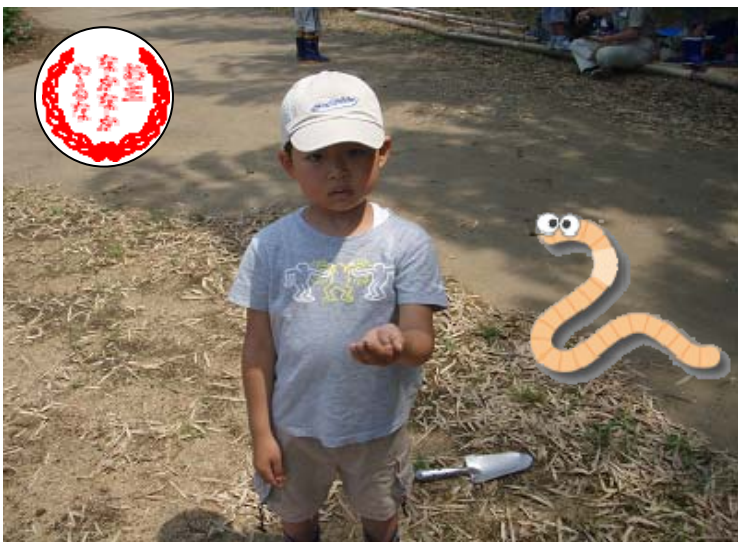
ミ・ミズ…… マスコット隊員の写真。