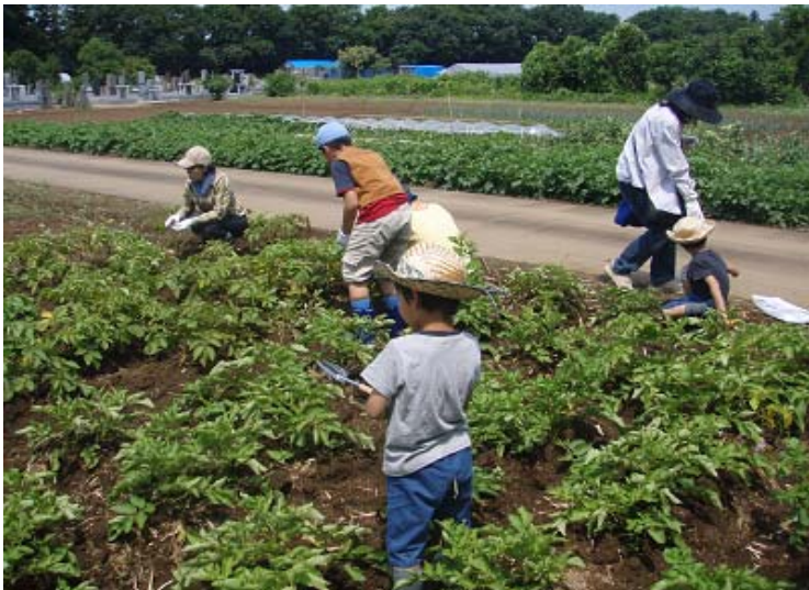
スカウト・父兄の草取りと、新入隊の双子のビーバーちゃんの写真。