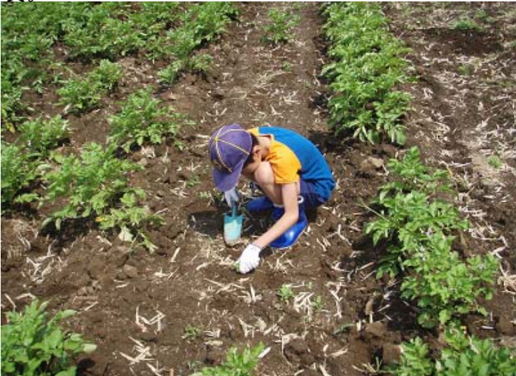
カブスカウト草取りの写真。