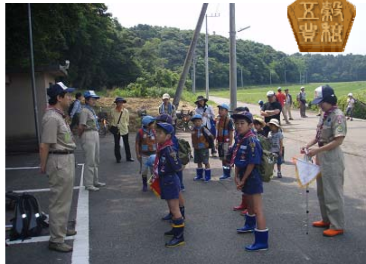
本日は、暑い中ごころうさん。7月には収穫祭だ。