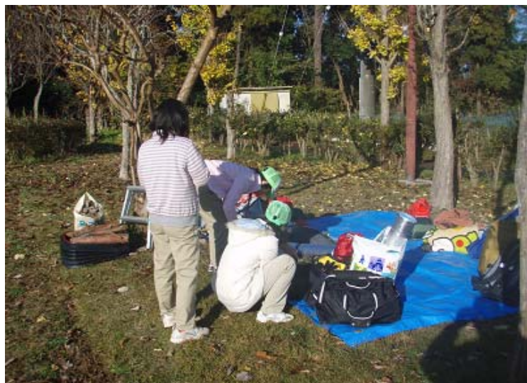
ボーイ隊集合！のようす。

長い表題となってしまった。今年も、いつもお世話になっている、刈谷ベテランズの皆様と交流会を行いました。恒例の餅つきペッタン体験とお餅をご馳走になるお礼に、トン汁と焼きサンマ（昨年までは焼き鳥であったが食の安全性を重視してサンマとしたらしい）を作ります。今回も昨年の里美かかし祭の賞金で購入した薪ストーブが活躍です。段取り8分仕事2分。ボーイ隊は段取りのため他の隊より早めの8:30集合です。「ゆふ将軍」の到来は、本日、勤務のため影響はありません。Mインストラクター「とりあえず、火を起こし、お湯を沸かせ！お湯が沸いたら出来たようなもんだぜ！」ボーイ隊は交流会終了後、新入隊（またまた女子スカウト、カッパ5というらしい）歓迎耐寒キャンプに突入だー！ うん？去年も新入隊員歓迎耐寒キャンプだったような・・・。 昨年のように、ボーイ隊長がお餅が食べ過ぎなければ良いのだが・・・。