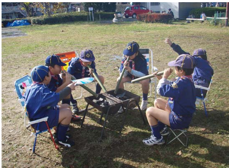
ヤブ蚊の集団発生か？ いえ、いえ。火吹き竹で炭燻します。

今回のミッションは、11時までに、トン汁80人前を作り サンマも80匹上手に焼くのだぞ！