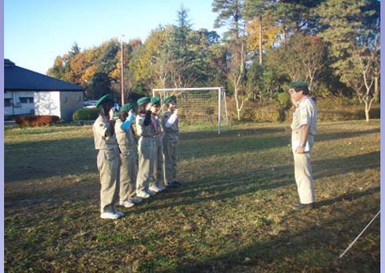
国旗儀礼・朝礼、スカウト・オン後、朝食。今回は「ホット・サンド(ピザ風)」。

これより、牛久商工会青年部ウォークラリーへ、いざ！出陣だー！完歩賞とトン汁(昨日の昼も夜も食べたけど)と河童米(無農薬米)のオニギリはもちろん、高成績チームには、商品もあるそうだ。普段の訓練のお手並みを拝見！チームは5名で、子供が参加の場合は必ず大人を1名入れなければならない。なので、スカウト1名とMインストラクターは、キャンプサイトで留守番となるのはずが、スカウト1名体調不良でリタイア。1人ぼちでの留守番となった。スカウトがいないと、単なるアウトドアマニアしか見えないM副長であった。