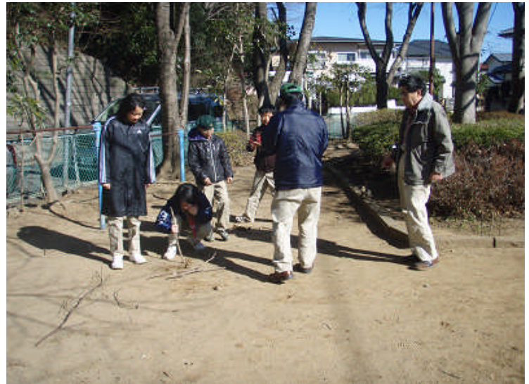
追跡記号。小枝で記号を作っているように見えるが、実はサボって地面に落書きをしている。