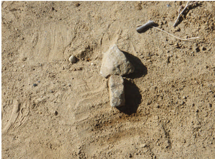
追跡記号。これは分かりやすいが、あまりにも簡単すぎて敵(誰なんだ?)に見つかりやすいぞ！

本日は、強風で寒い！周辺の畑は土ぼこりで真茶っ茶。刈谷自治会館の広場で開催予定だったが、急遽、隊長宅へ変更。寒い！最初は座学で勉強するが室内では限界がある。ボーイスカウトは野外を教場として活動するのが寒いものは寒い！。だが、手旗・追跡室内では出来ない。意を決して近くの公園で実技を行った。