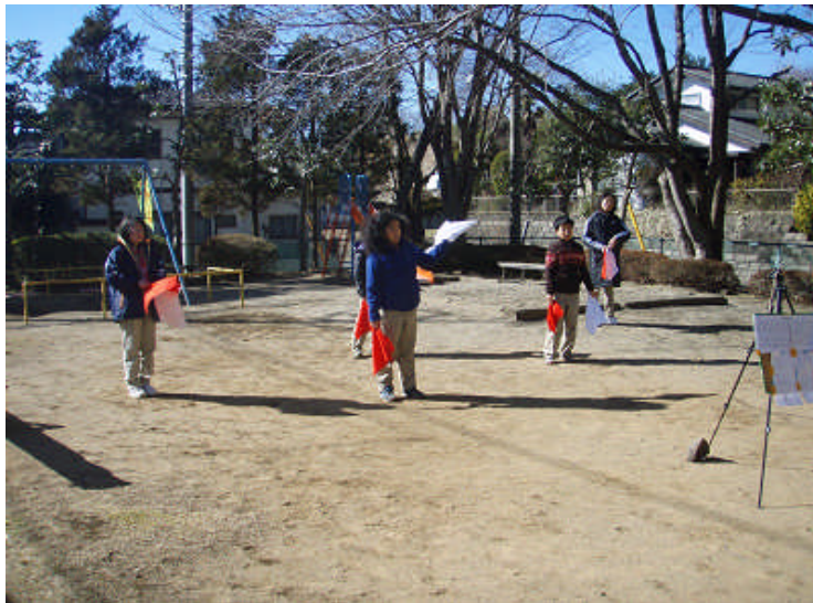
手旗信号。相手に読みやすいように逆文字なので、チョット頭が混乱するようだ。