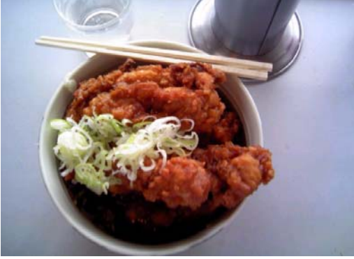
2個乗せ唐揚げソバ(350円)

す*うのでこゆを高さ日乗ば王 。注で大すのは掛校まはつー台初 意す将。唐かけ生せ、かを駅回 ：。元揚な薬がん朝りごには 天現こ々げり味食でかま紹も、 王在と弥そ濃の券しらす介あM 台で、生ばくネをた唐。しり副 店は山軒を、ギ渡。揚Mまま長 の駅下は遠熱乗す唐げ副すすの 唐構清駅方くせと揚2長。〜通 揚内画弁か、た、げ個も3の勤 げの伯屋らソも味へ乗ビ0、ル の売がさわバの噌1せッ0立↑ 入店約んご・が汁個をク円ちト 荷と五でわう出の5頼リで喰に は立年、ざどて御0んの大いる 、ち間昭食んき椀円でボ人ソる 午喰働和べはまに〜しりのバ常 前いい十に茹し唐はま↑ぶの屋磐 十ソて七来でた揚単い↑ぶの線 一ぱい年るす。げ品、ムし弥我 時中た頃フぎ残をで夕感大生孫 以心とにアで念入販方での軒子 降だいはンすなれ売ます唐一駅 だそうあも。が、しで。揚唐ホ そうおの多しらソてお初げ揚↑ うで店、いかソバい腹めがげム ですだ〜そしバつてがて一そへ 。そ裸う、つゆ、空の個天