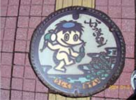
良くあるマンホール カラーバージョンもあるようだ