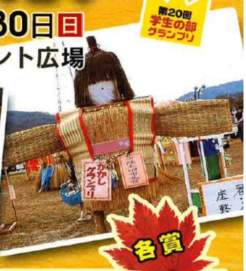
第20回 学生の部 グランプリ