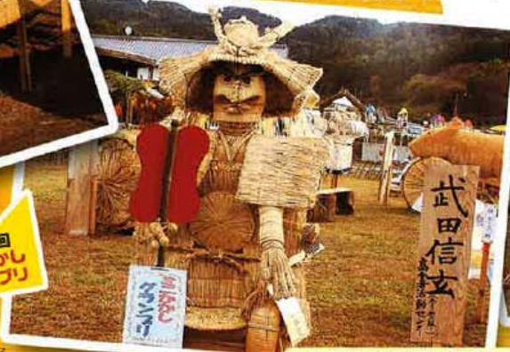
第20回 ミニかかし グランプリ