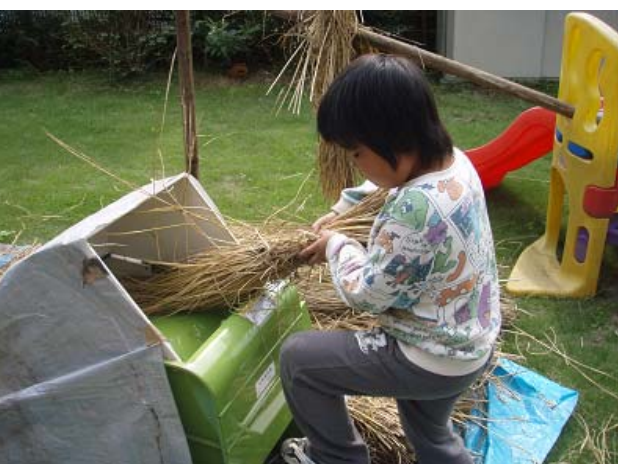
足踏み脱穀機を操る近所に住むビーバースカウト