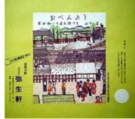
山下画伯デザインの弁当の包み紙