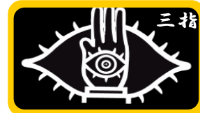
これは作業キャップのデザイン(案)

三指(さんし) とは、ボーイ以上の敬礼やスカウトサインでの指の形。デザイン画のように、右手の親指と小指を付けて人差し指、中指、薬指の三本指をたてる。三指は三つのちかいを表す。「ちかい」とは、スカウティングの原理であり、ボーイ隊以上に上進・入隊のときには、この『ちかい』を立てる。「私は名誉にかけて、次の3条の実行をちかいます。」 1. 神(仏)と国とに誠を尽くし、おきてを守ります。2. いつも、他の人々をたすけます。3. からだを強くし、心をすこやかに、徳を養います。である。スカウト同志の手紙やメールに「拝啓……敬具」の代わりに、はじめにかく挨拶語として「三指」を用いることがある。この場合は「三指……弥栄(いやさか)」とする場合が多い。 弥栄(いやさか) ?また、スカウトたちが聞きなれない言葉が出てきたので、これも説明しておくことにしよう。いやさか(弥栄)とは、「ますます栄える」、「万歳」、「おめでとう」などと言う意味で、ボーイスカウトの祝声のことを言う。世界各国のスカウトは自国語の祝声を持っているが、世界共通の祝声として、日本で行われている「いやさか」が採用されている。それはなぜか?大正11年、日本連盟が誕生した時日本のスカウトの祝声として「弥栄」を採用したが、大正13年、佐野常羽がイギリスのギルウエルでこれを披露したところ好評でそれ以来ギルウエルの祝声として「弥栄」が用いられているそうである。ちなみにM副長は、イギリスは行ったことはない。やり方は、・「いやさか用意!」で、・右手にペレーをつかみ、・右斜め下方向より物をすくうように上に持ち上げながら、「いや~さかっ!」「いや~さかっ!」「いや~さかっ!」と3回繰り返す。 *ちなみに4団発団20周年記念式典の際、友団からこの「弥栄」の祝声でお祝いしてもらったが、覚えていかなー?