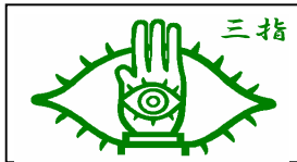
ステッカーはこんな感じ

このマークは、スカウトたちに大好評である。コミックを映画化したあの「20世紀少年」を、上手に流用したものである。映画では本来1本指であった。昨年のカブキャンプの際に、カブの敬礼やサインの2本指にしてみたが、なんと御本家さまが映画第2弾で2本指にしてみたではないか！では、こちらは、スカウトの敬礼で行う【三指】にしてみた。やはり、スカウトたちには、怪しいこのマークに興味があるようである。このマークは、業界の選ばれし者のみが貼ることを許される。(密かに世界制覇を企てるM副長+1である)その条件とは、【マニアではなく、単なる物好きであること】である。ちなみに、こういう物を考える自体が、マニアとの声もある。