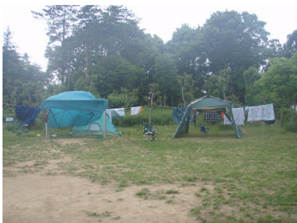
ロープを張ってMyシュラフも干す。