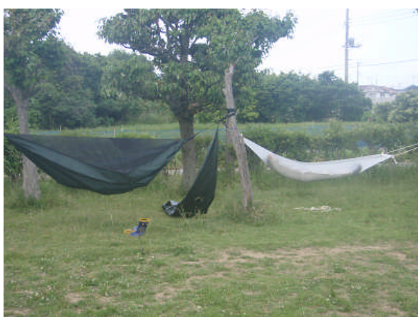
息子カブと、ボーイ隊長はリラックス中。