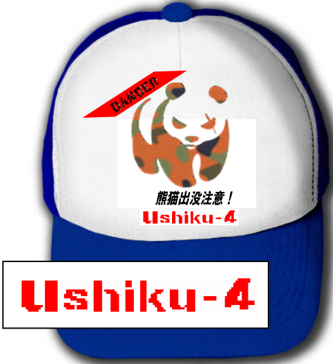
作品名:「迷彩パンダ」パロディ系。野営は日々自分との戦いである。ロゴは米軍風。