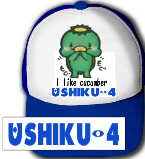
作品名:「きゅうり大好き」牛久沼の河童をイメージした。ロゴはモンスタースターインク風。