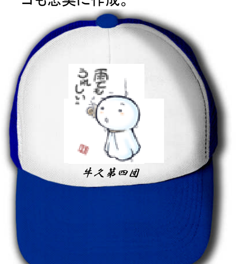
作品名:「テル坊」癒し系。活動にの晴天を願う。