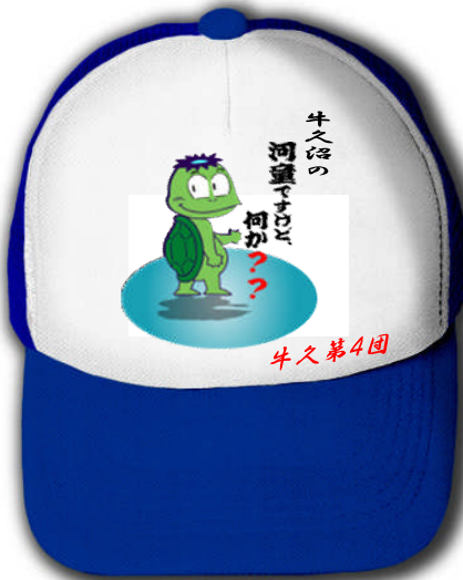
作品名:「見返り河童」牛久沼の河童をイメージした。