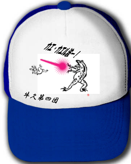
作品名:「カエカエル波!」鳥獣戯画パロディ系ドラゴンボール。