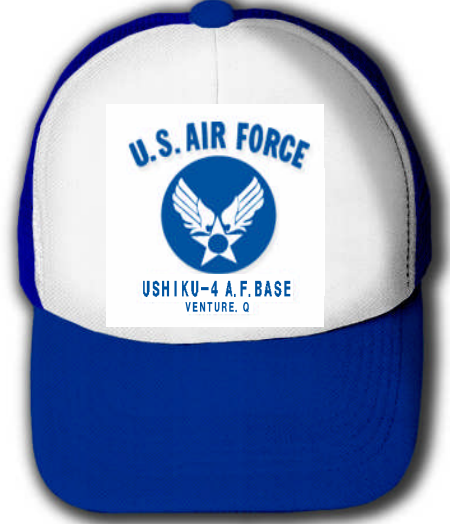
作品名:所ジョージ「世田谷ベース」のパロディ系。