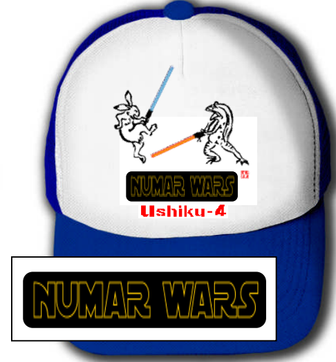
作品名:「ヌマー・ウォーズ」鳥獣戯画パロディ系スター・ウォーズ。ロゴも忠実に作成。