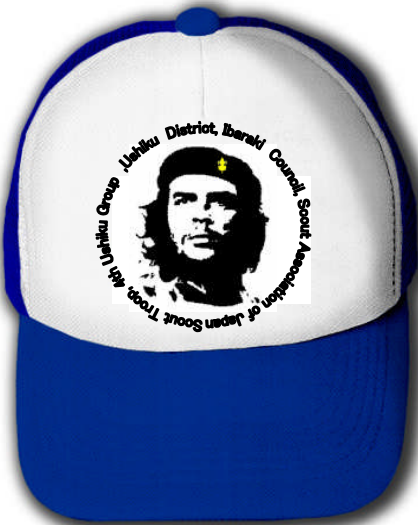
作品名:「革命の戦士」パロディ系。ベレーにはベンチャー記章。