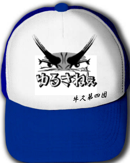
作品名:「ゆるさねえ」パロディ系何を「ゆるさねえ」かは自分次第。